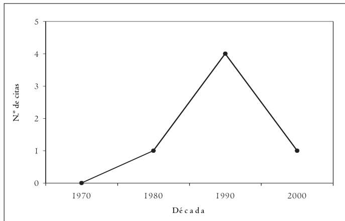
Figura 2. Número de observaciones registradas en el sistema Central en las últimas décadas.

Tras dicha extinción, desde finales de los 70 hasta la actualidad ha habido media docena de observaciones de la especie en el sistema Central. El 12 de octubre de 1984 se observa un ejemplar en el Espinar (Segovia; Antor et al. 2000). En enero de 1990 se localiza un adulto en Robledo de Chavela (J. Viñuelas en Sunyer y Heredia 1990). Posteriormente, hay dos observaciones que tuvieron lugar en el año 1991 (Antor et al. 2000), correspondientes a individuos jóvenes: un individuo observado en el pico Almenara (Robledo de Chavela) el 6 de mayo por R. Sánchez y el 9 de noviembre en el puerto de Cotos (vertiente del Lozoya)