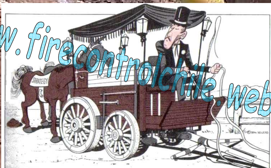
Fig 3.4.3: Algunos nunca entienden. El plan nació muerto.

RECORDAR: La estrategia viene primero y guía al Plan. El Plan debe seguir y adecuarse a la estrategia (el caballo va adelante de la carreta, no atrás).